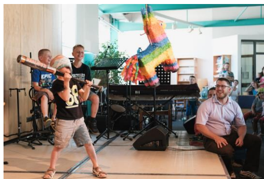
(Piñata gefüllt mit Süßigkeiten)

Im Nachmittagsprogramm hatten auch die Kinder ihren Spaß beim traditionellen Piñata-Schlagen: